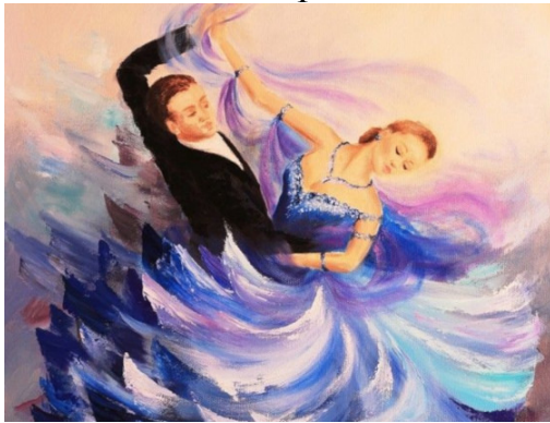
«Вальс». Детские переживания быстро

«Похороны куклы». Первое детское горе всегда глубоко и значительно. Искренние переживания, слезы композитор рисует с уважением к трагедии и личности ребенка.